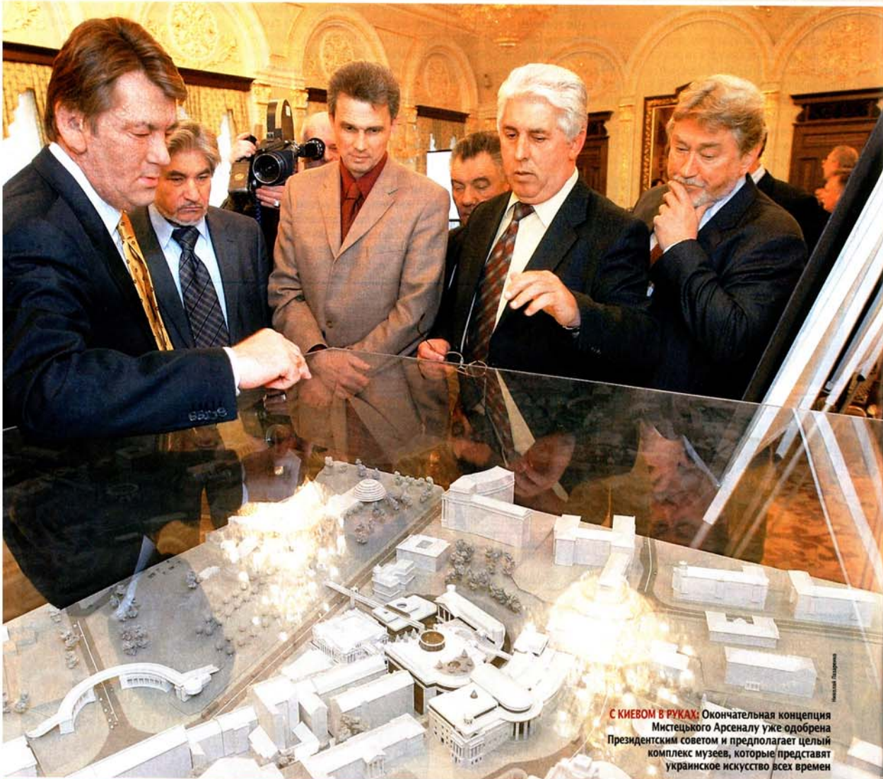
С КИЕВОМ В РУКАХ: Окончательная концепция Мистецького Арсеналу уже одобрена Президентским советом и предполагает целый комплекс музеев, которые представят украинское искусство всех времен