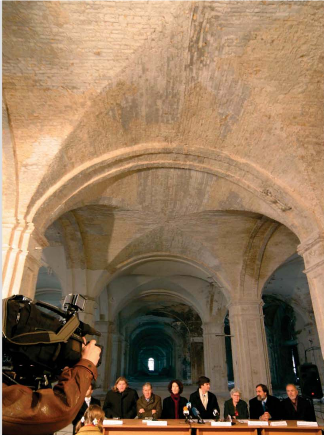
Склепіння Старого арсеналу