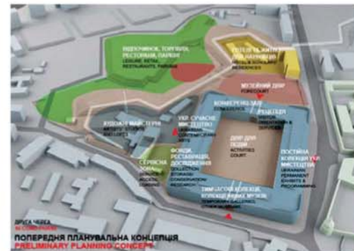
Попередня планувальна концепція. Перша та друга черга